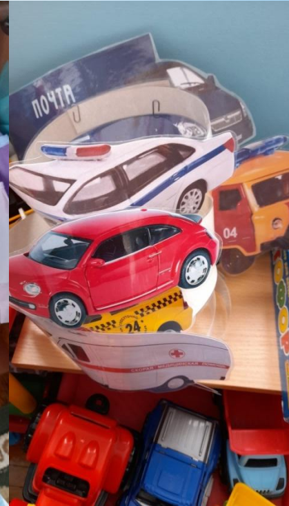
Изготовление костюмов и атрибутов для сюжетно - ролевых игр