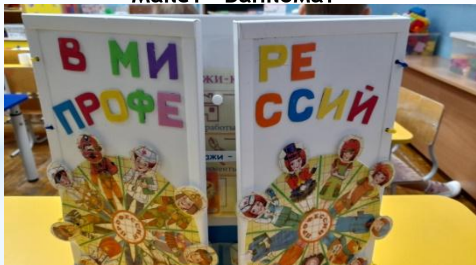
Лепбук «В мире профессий»