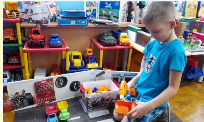
Дидактическая игра «Какие инструменты нужны автомеханику?»