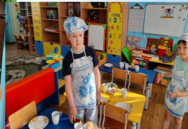
«Знакомство с обязанностями помощника воспитателя»