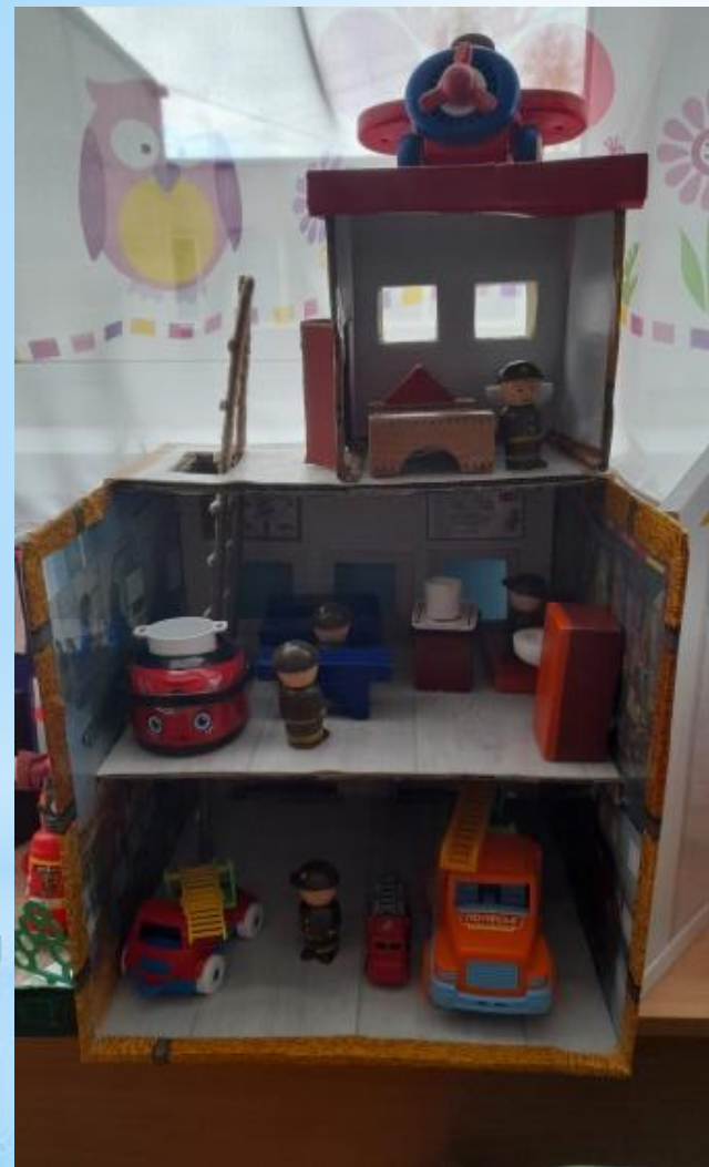
Макет «Пожарная часть»

Обогащение предметно-пространственной среды в группе