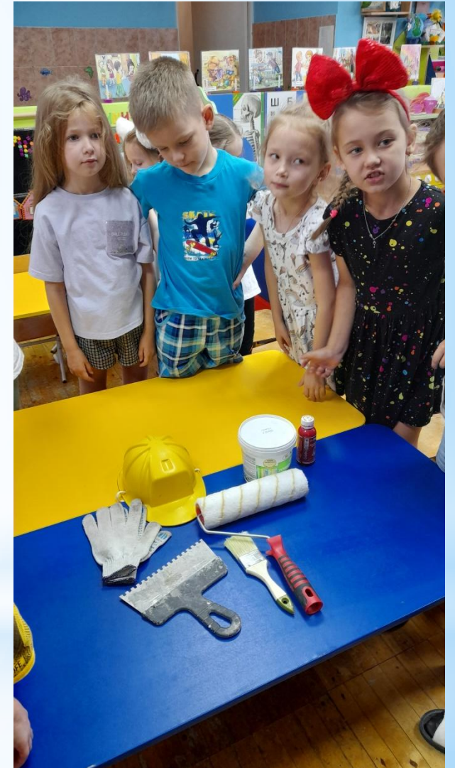
Профессия маляр- «Путешествие на строительную площадку»