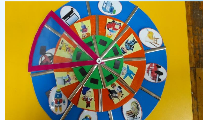
Круги Луллия - «Профессии»