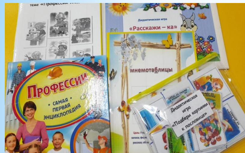
Энциклопедии, мнемотаблицы, пословицы о труде и др.