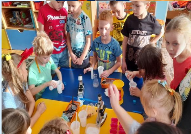
Профессия лаборант- «Путешествие в лабораторию»