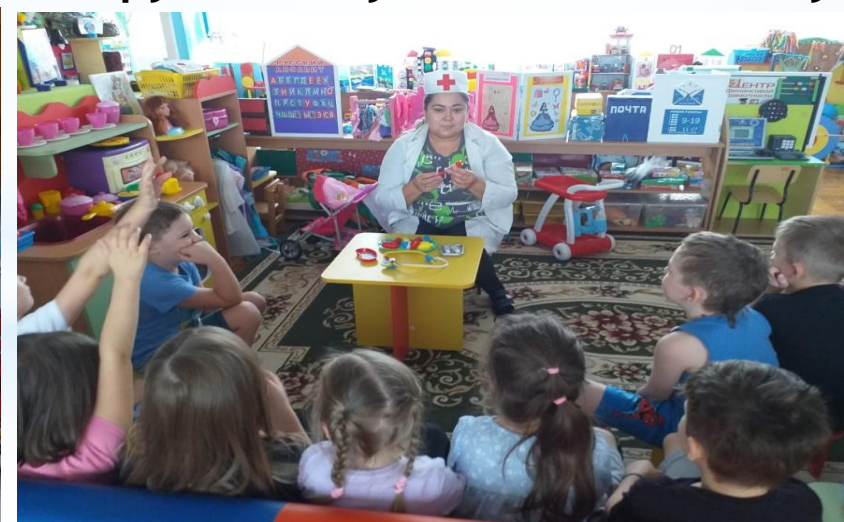
Дидактическая игра «Что нужно врачу для работы»