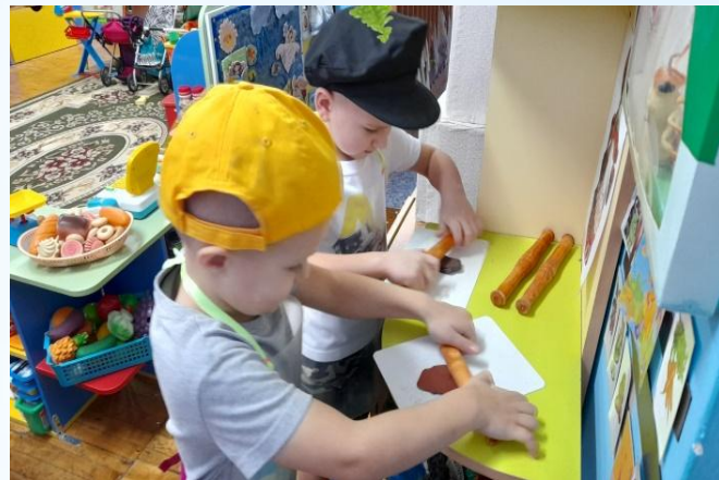
«В гончарной мастерской»