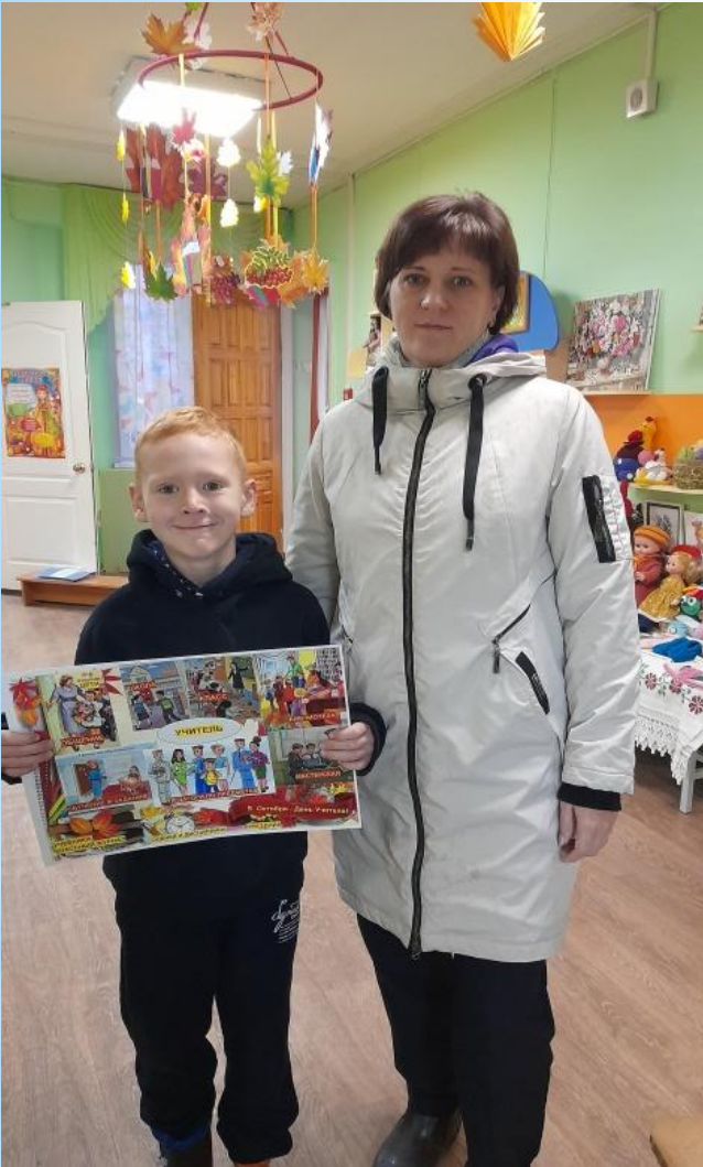
Изготовление интеллект - карт на тему: «Профессии»