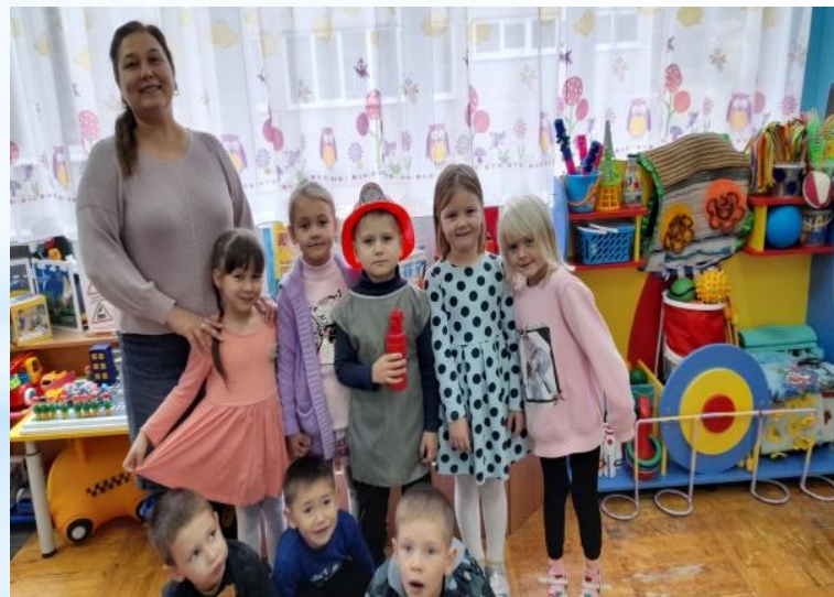
«В пожарной части»