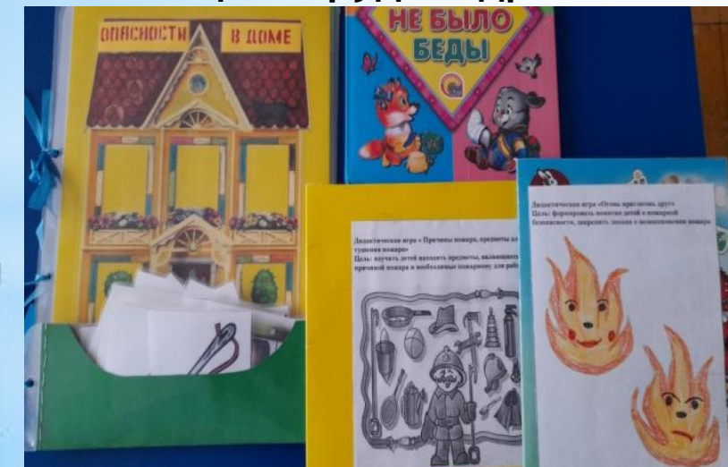
Дидактические игры по безопасности