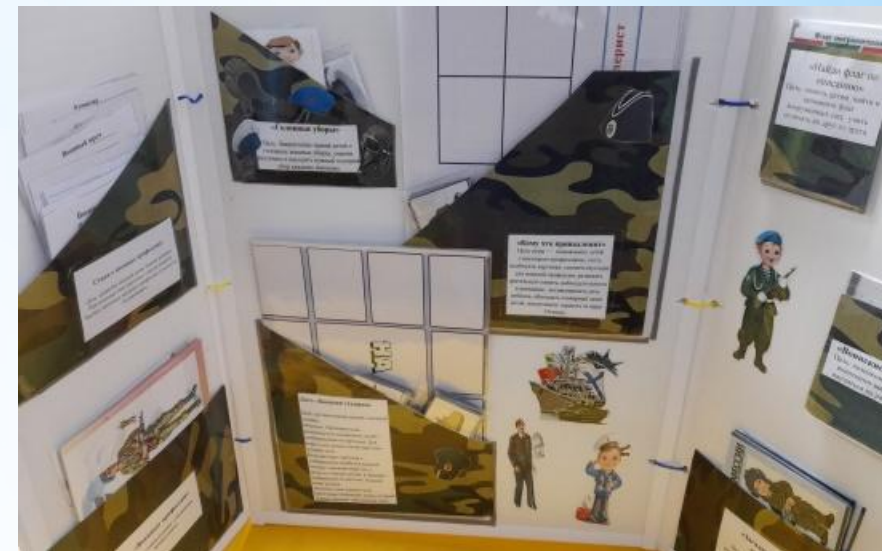
Лепбук «Профессия военный»