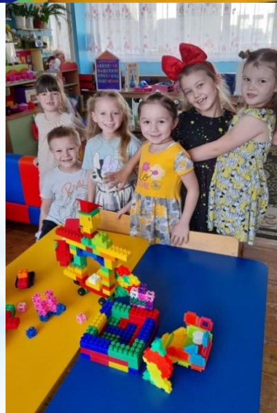
«Строим город будущего»

Совместная трудовая деятельность, как метод развития общетрудовых умений и способностей детей, психологической готовности к труду