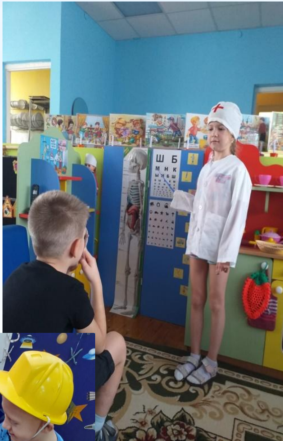
«На приеме у врача»